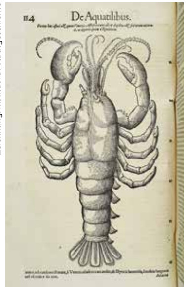
Historia animalium (4. Band) von Conrad Gesner von 1558, Seite 114