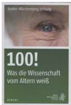
Baden-Württemberg Stiftung: 100! – Was die Wissenschaft vom Altern weiß“, Hirzel Verlag 245 Seiten, geb. 19,90 Euro

sens, Baden-Württemberg, gilt als das Bundesland mit der höchsten Lebenserwartung. Die Baden-Württemberg Stiftung hat deshalb eine Vielzahl von Projekten angestoßen und gefördert, die sich mit den unterschiedlichen Facetten des höheren Alters beschäftigen. Das Buch „100! – Was die Wissenschaft vom Altern weiß“ legt einen Überblick über die verschiedenen Ansätze vor und informiert über wissenschaftliche Erkenntnisse. Vor allem fachinteressierte Menschen, die beruflich mit dem Thema Altern zu tun haben, können hier Neues erfahren. Dass dazwischen Interviews mit über 100-Jährigen eingestreut sind, erleichtert das Lesen und gibt dem Altern ein Gesicht. wdl